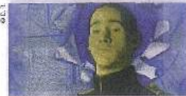
La Réforme Goutard.