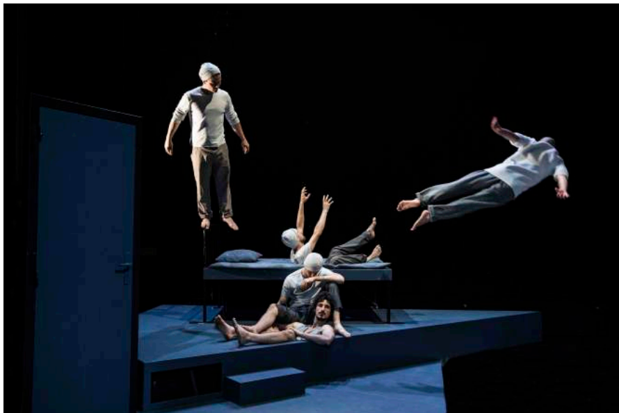
Photographie de répétitions : Géraldine Aresteanu